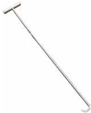
Laatikonvetokoukku T56 2062