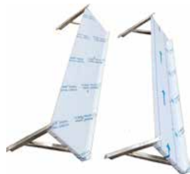
Hyllytaso T56 2070