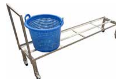
Pitkä kärry T56 2047