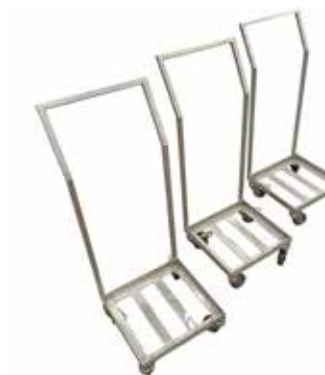
Matala tuotekärry T56 2051