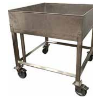
Tuoteallas T56 2045