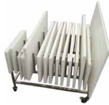
Leikkuulautateline T56 2053