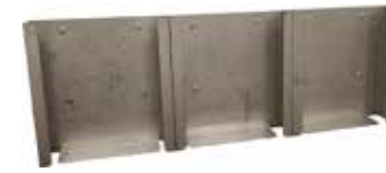
Teline kumihanskalaatikoille T56 2079