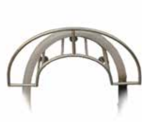
Letkuteline T56 2064