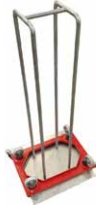
Rullakoteline T56 2069