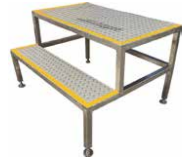
Korkeampi porraskelma T56 2072