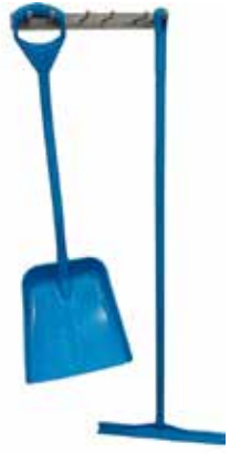
Naulakko pesuvälineille ja lastoille T56 2067