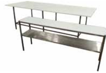
Leikkuupöytä T56 2054