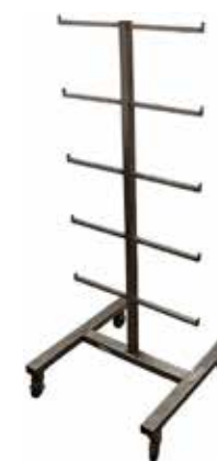
Etikettirullateline T56 2050