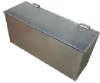
Kannellinen seinälaatikko T56 2059