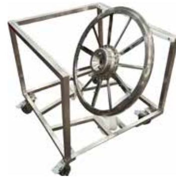
Teräteline, jossa pesua helpottavat pyörivät rullat T56 2056