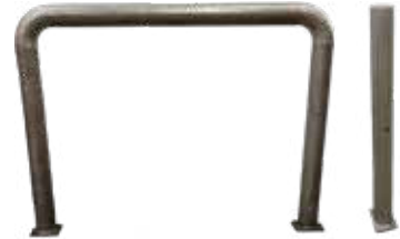
Törmäyssuojat T56 2076 ja T56 2077