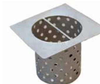
Lattiakaivon roskasihti T56 2063