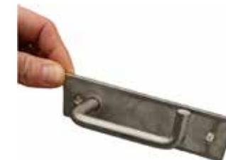
Rikkakihvelipidike T56 2073