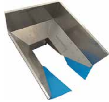
Kaukalot/suppilot T56 2060