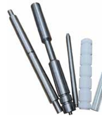
Akselit ja telat kuljettimiin tai koneisiin T56 2085