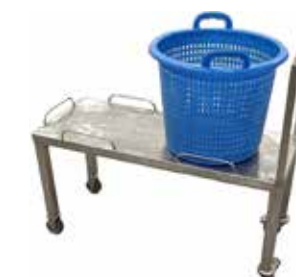
Tuotekärry koreille T56 2049