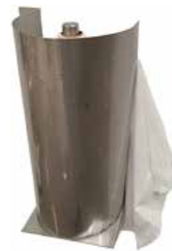
Roiskesuojattu liinateline T56 2074

Kokosimme tähän mukavan otoksen valmistamistamme tuotteista. Jos et löydä tästä tarvitsemaasi, kerro rohkeasti mitä tarvitset. Jos et tiedä millintarkkoja mittoja, ota puhelin käteen ja soita – me vastaamme.