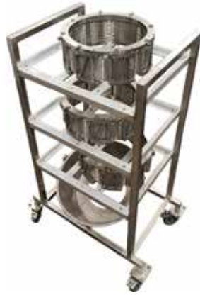
Teräteline, jossa hyllyt T56 2055