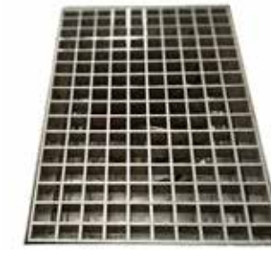
Vahva lattiaritilä T56 2081