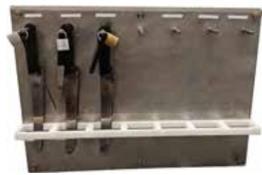
Lukollinen veitsiteline T56 2065