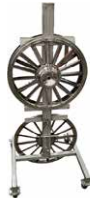
Pysty teräteline T56 2068