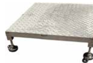
Korotusaskelma T56 2061