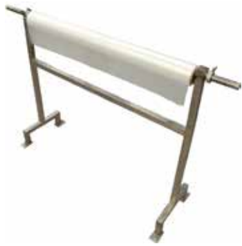
Mollapussiteline T56 2066