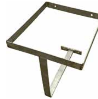
Seinäteline pesuainekanisterille T56 2078