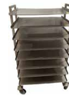
Tuotehyllyvaunu T56 2046