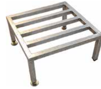
Taso T56 2044