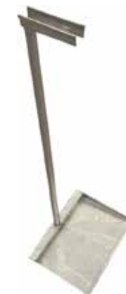
Rikkakihveli T56 2075