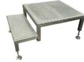
Porraskelma T56 2071