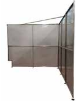
Tilanjakosermi T56 2083