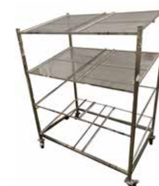
Tuotekärry laatikoille T56 2048