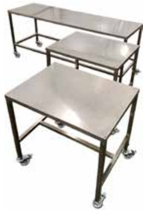
Teräspöytä, eri kokoja ja tasovaihtoehtoja T56 2052