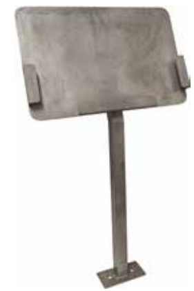
Pad-teline, pöytä- tai seinäkiinnitteinen T56 2086