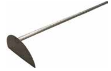
Tuotekaavin T56 2080