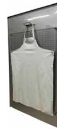
Essunpesupaikka T56 2084