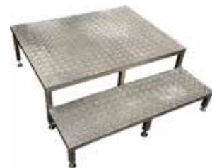
Askelmataso T56 2058