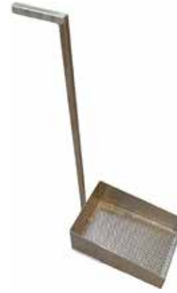
Varrellinen roskasihti T56 2082